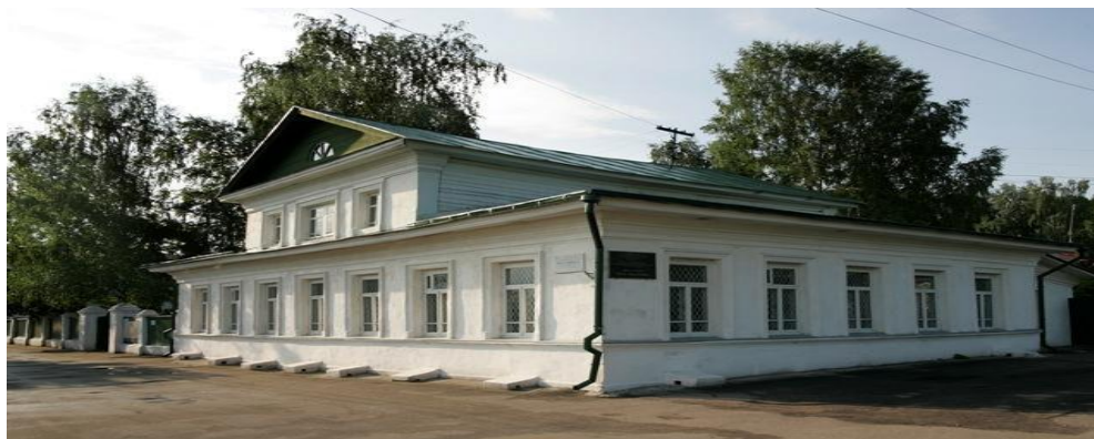
○ Дом-музей Левитана