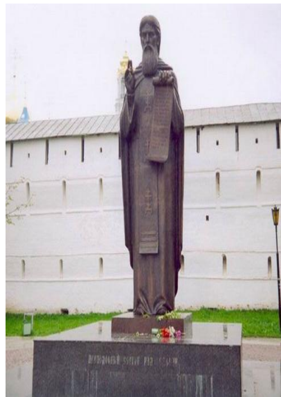
Памятник Сергию Радонежскому