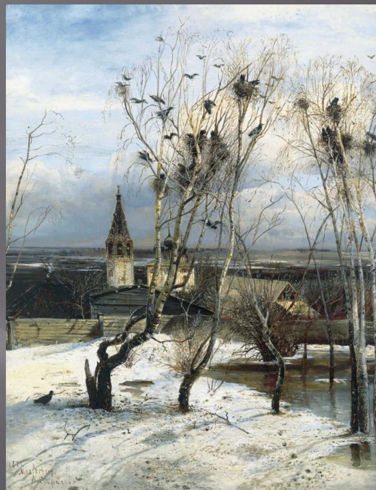
А САВРАСОВ ГРАЧИ ПРИЛЕТЕЛИ