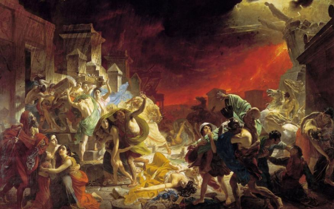
К.БРЮЛЛОВ ПОСЛЕДНИЙ ДЕНЬ ПОМПЕИ