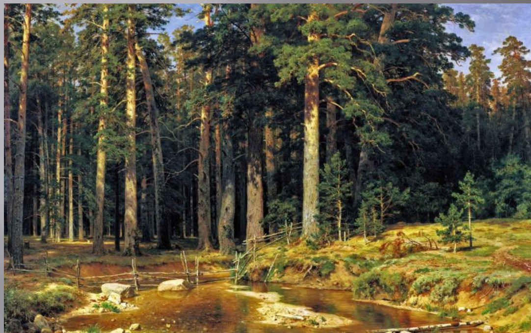
И. ШИШКИН. КОРАБЕЛЬНАЯ РОЩА