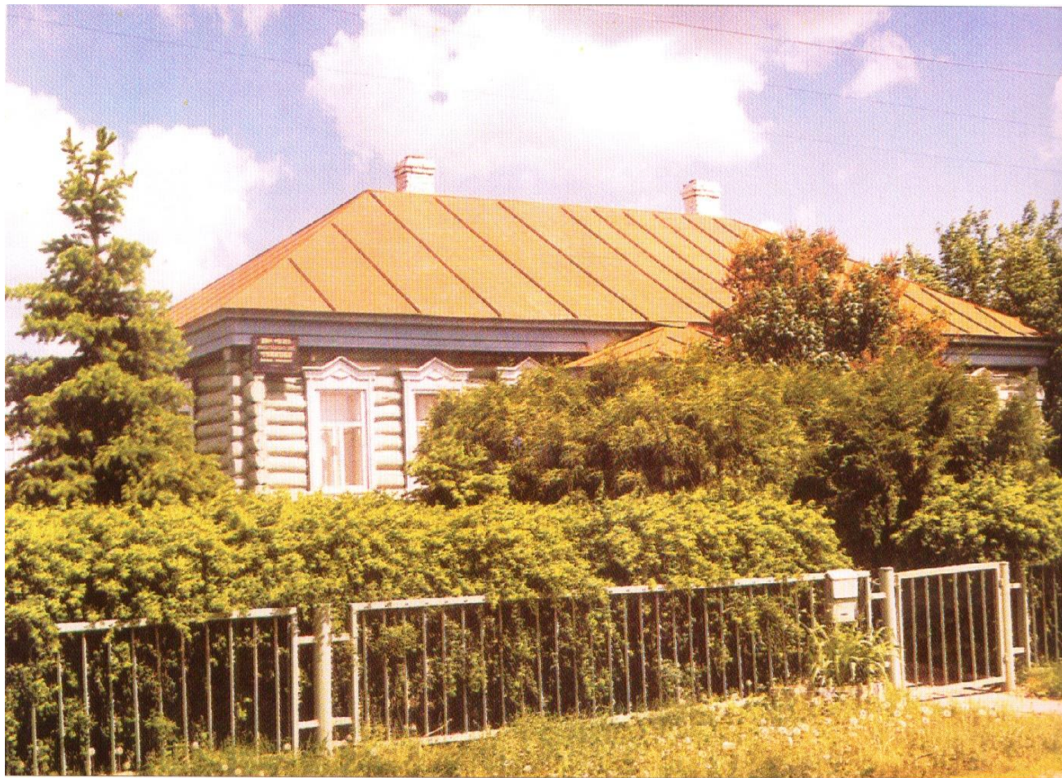
Дом-музей В. И. Чуйкова в Серебряных Прудах. 2001 г.