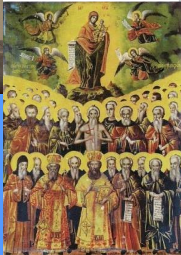
Οι Άγιοι Πάντες οι εν τῷ Ἁγίῳ Ὄρει ασκήσαντες Φορητὴ εἰκόνα ἱ. Ν. Ὁσίου Ἀγιορείτων Πατέρων Ἀντιπροσώπου ἱ. Μ. Κωνσταντινοῦ Καρυῶν (1796)