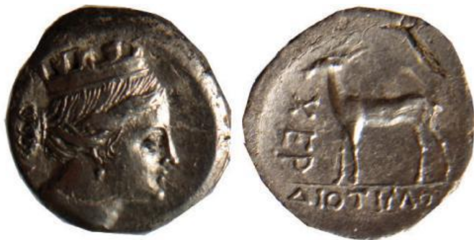
Дева в башенной короне. Серебро, конец 3 в. до н.э.