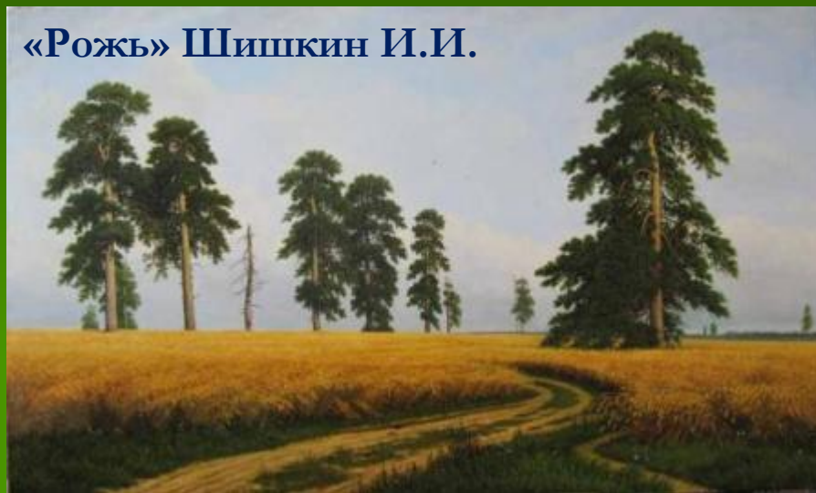
«Рожь» Шишкин И.И.