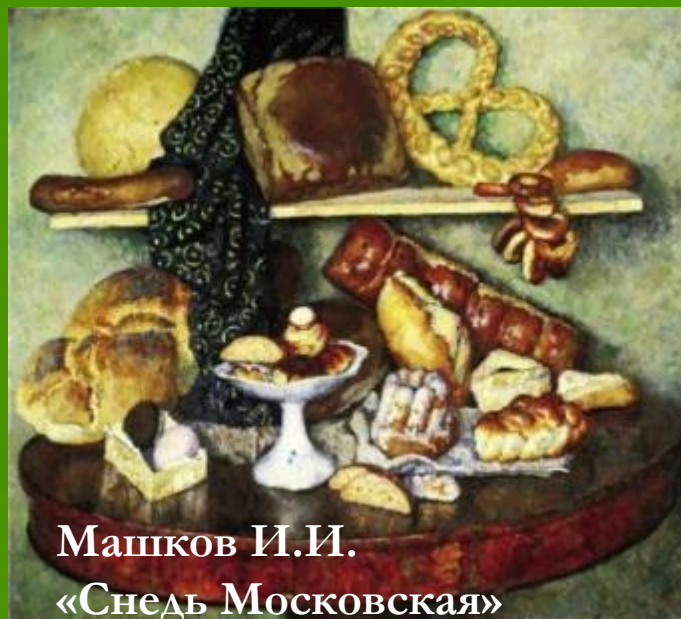
Машков И.И. «Снедь Московская»