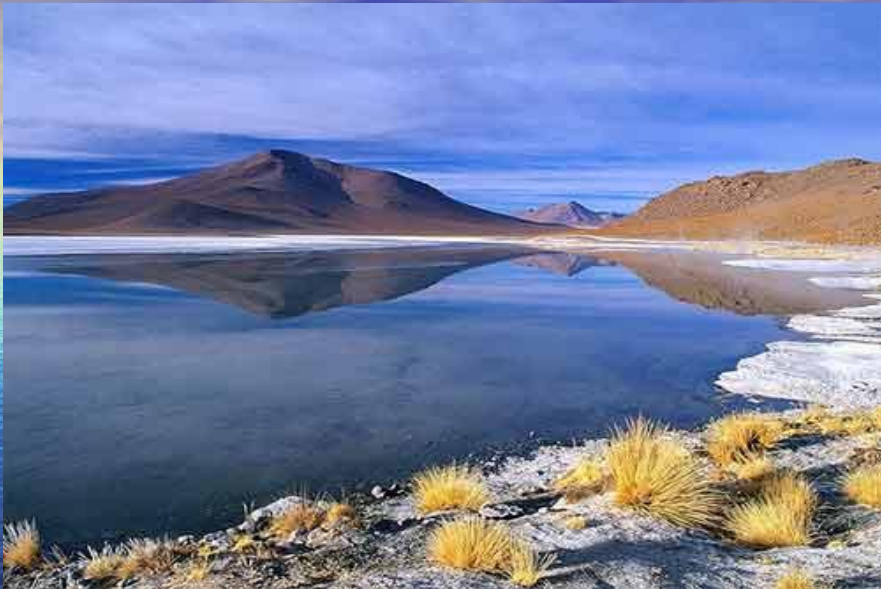
Большое соленое озеро в США