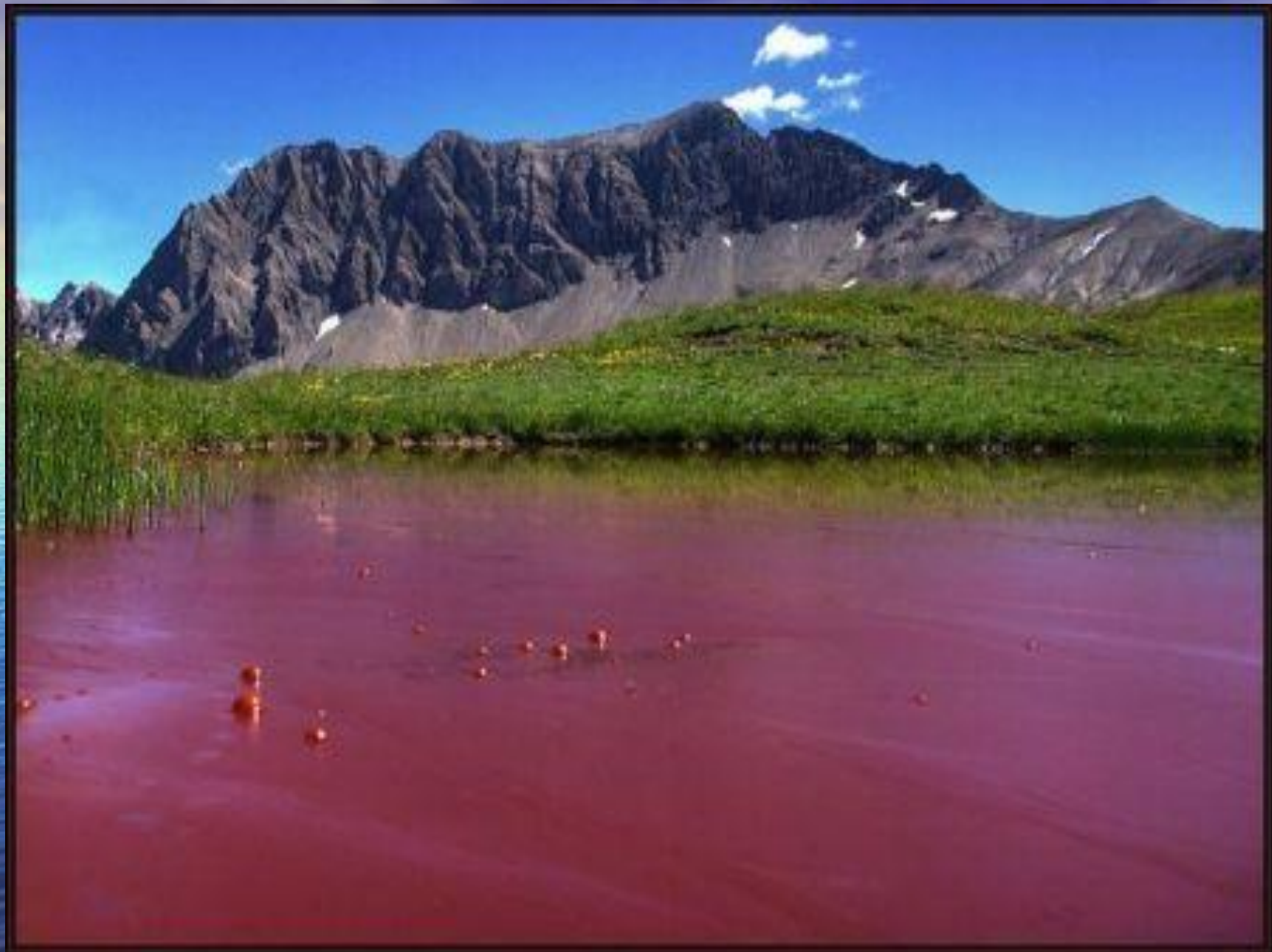
Глубокое Красное озеро в Швейцарии