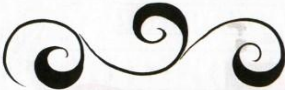
ВЕДУЩИЙ СТЕБЕЛЬ – «КРИУЛЬ»