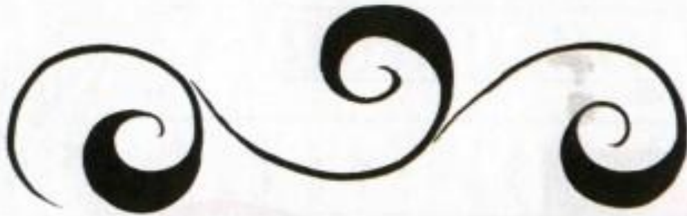
ВЕДУЩИЙ СТЕБЕЛЬ – «КРИУЛЬ»