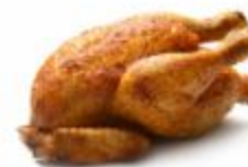
жареные и жирные продукты