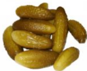
соленые и острые блюда