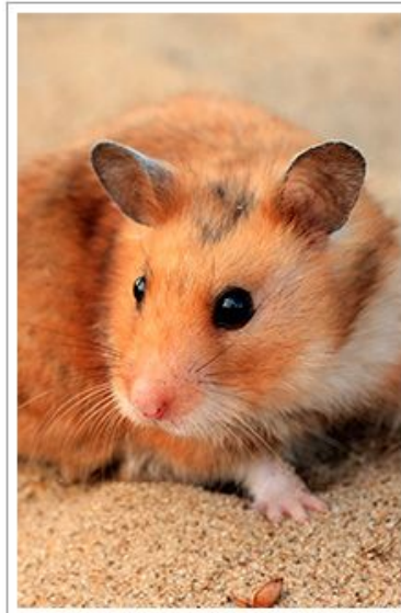
Золотистый сирийский хомяк

Все виды этих зверьков невелики: длина их тела варьирует от 5-6 до 20-34 см, а в среднем составляет 8-12 см. Главным отличием от других мелких грызунов является короткий хвост — его длина даже у самых крупных особей не превышает 4-6 см.