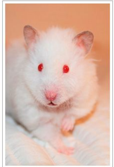
Белый сирийский хомяк