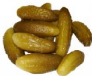
соленые и острые блюда