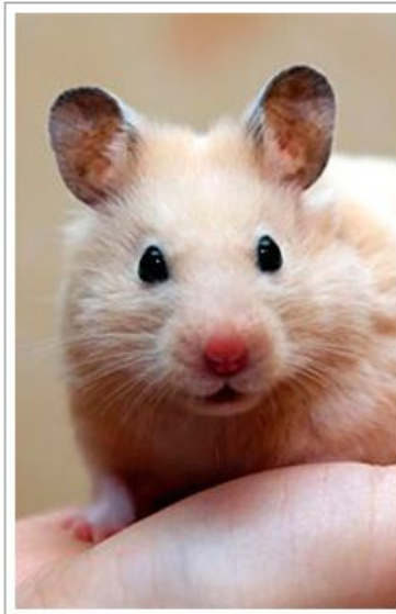
Кремовый сирийский хомяк