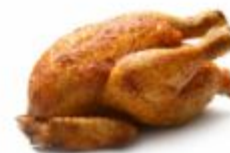
жареные и жирные продукты