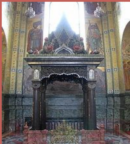
Сень над местом ранения