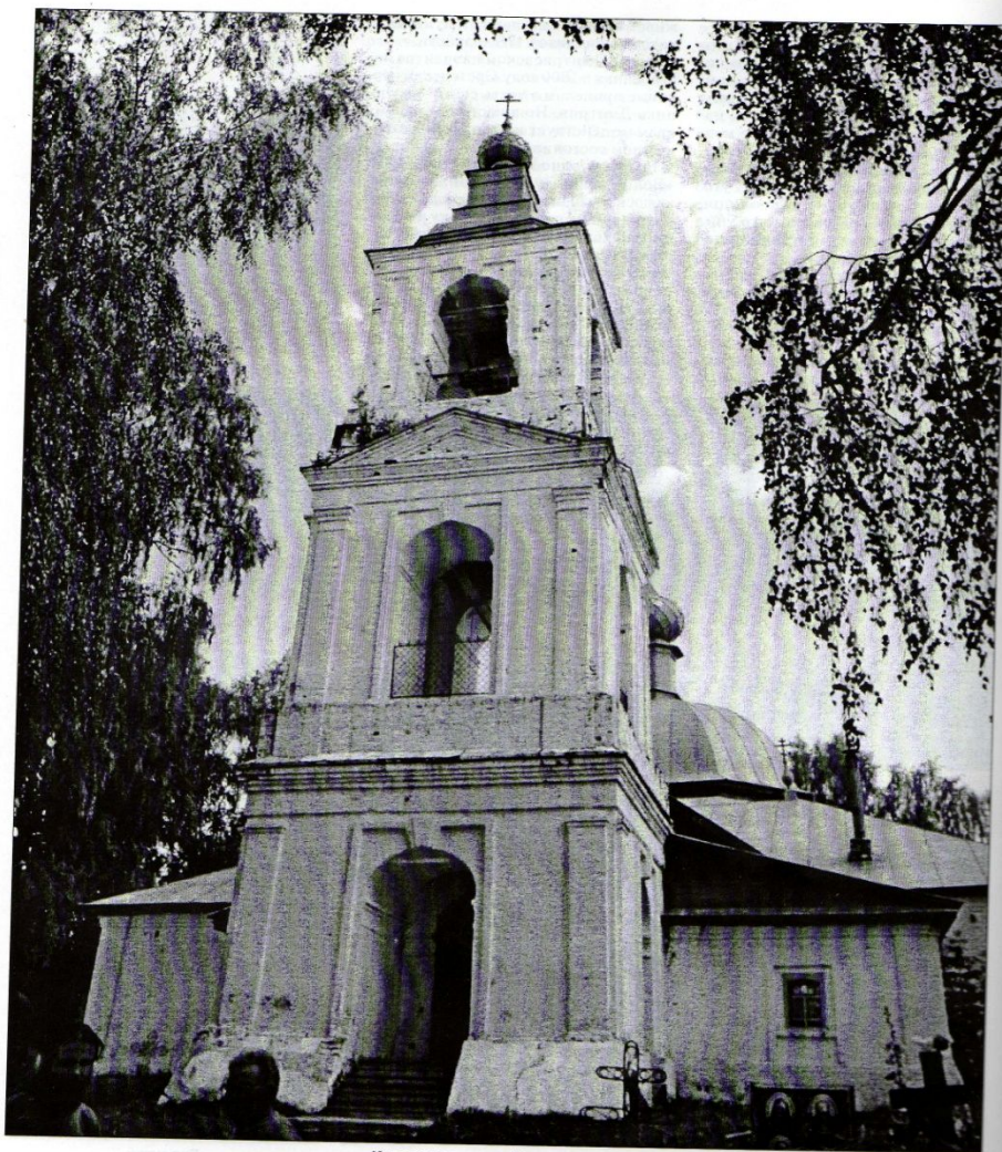
Колокольня села Воскресенье.