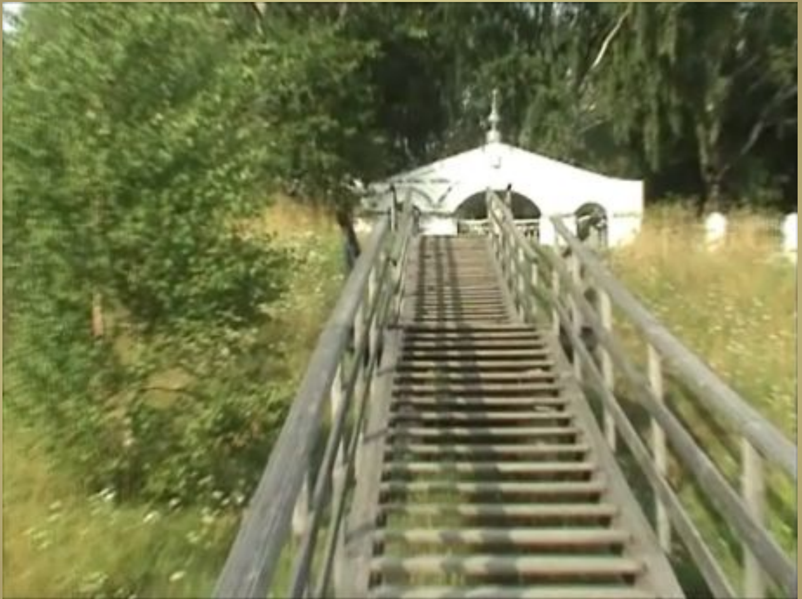
Деревянная лестница как восхождение на высоту к Храму