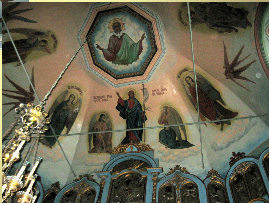
Роспись в притворе Храма