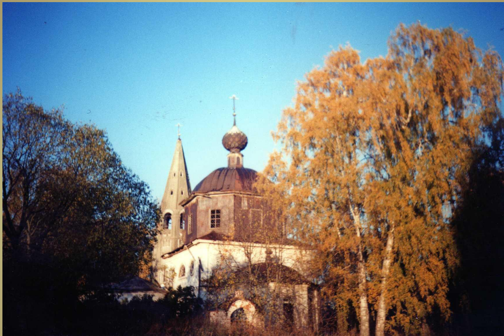
Вид на Николаевскую церковь с восточной стороны 2009 г.