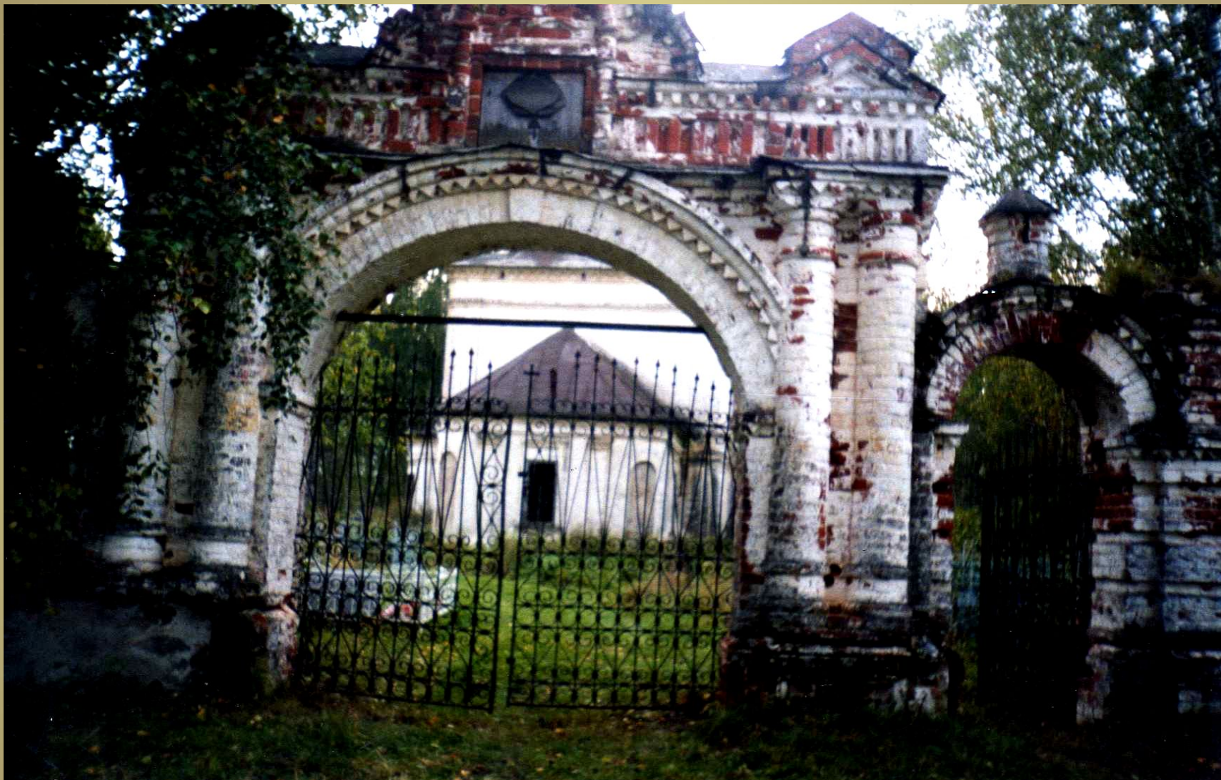
Центральные ворота ограды церкви св. Николая. Включены в перечень охраняемых объектов церковной архитектуры Нижегородской области