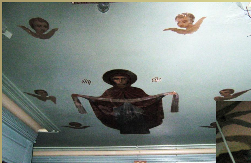
Роспись на своде Храма