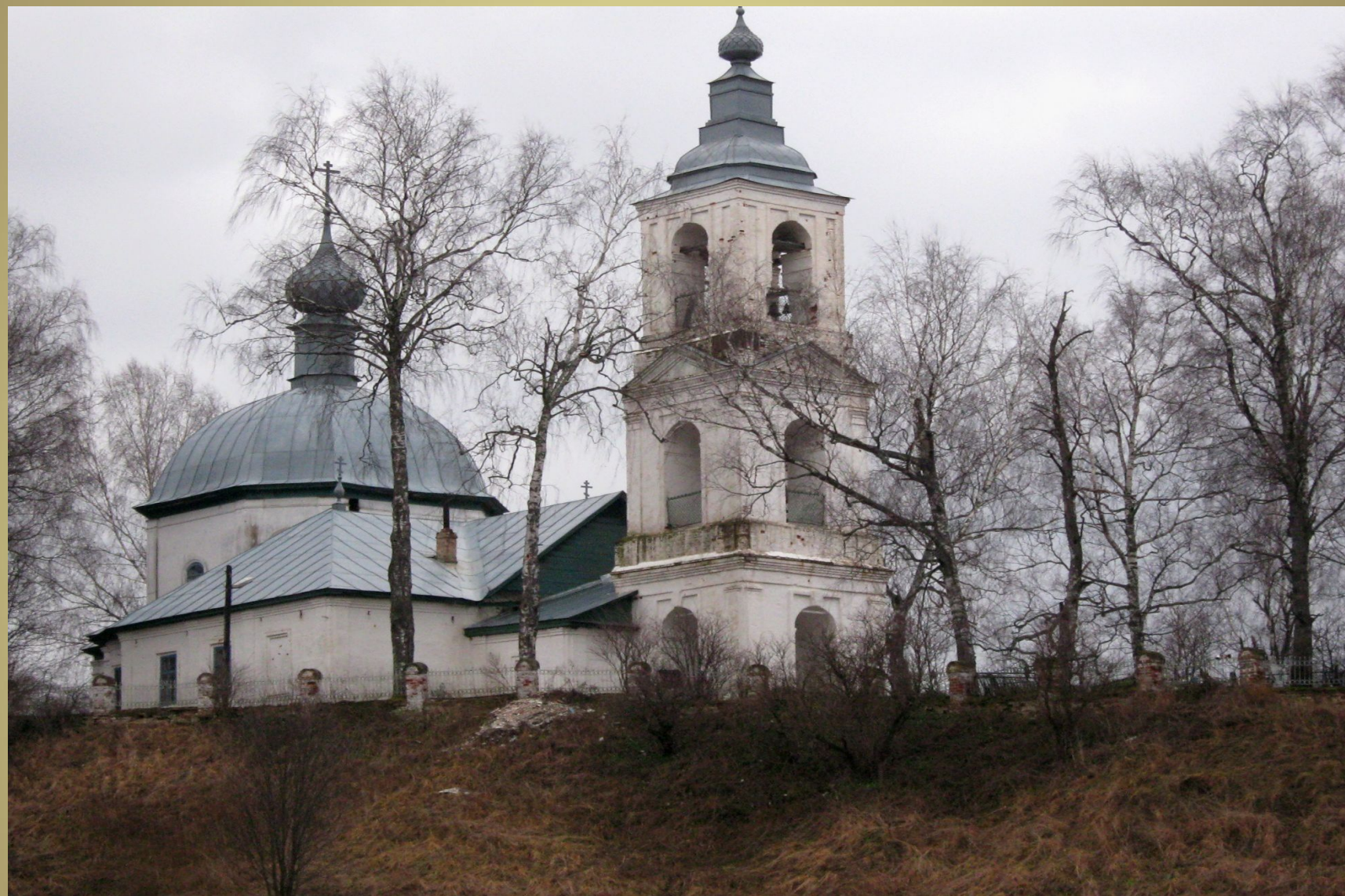
Храм в честь Воскресения Христова в селе Воскресенье (действующий)