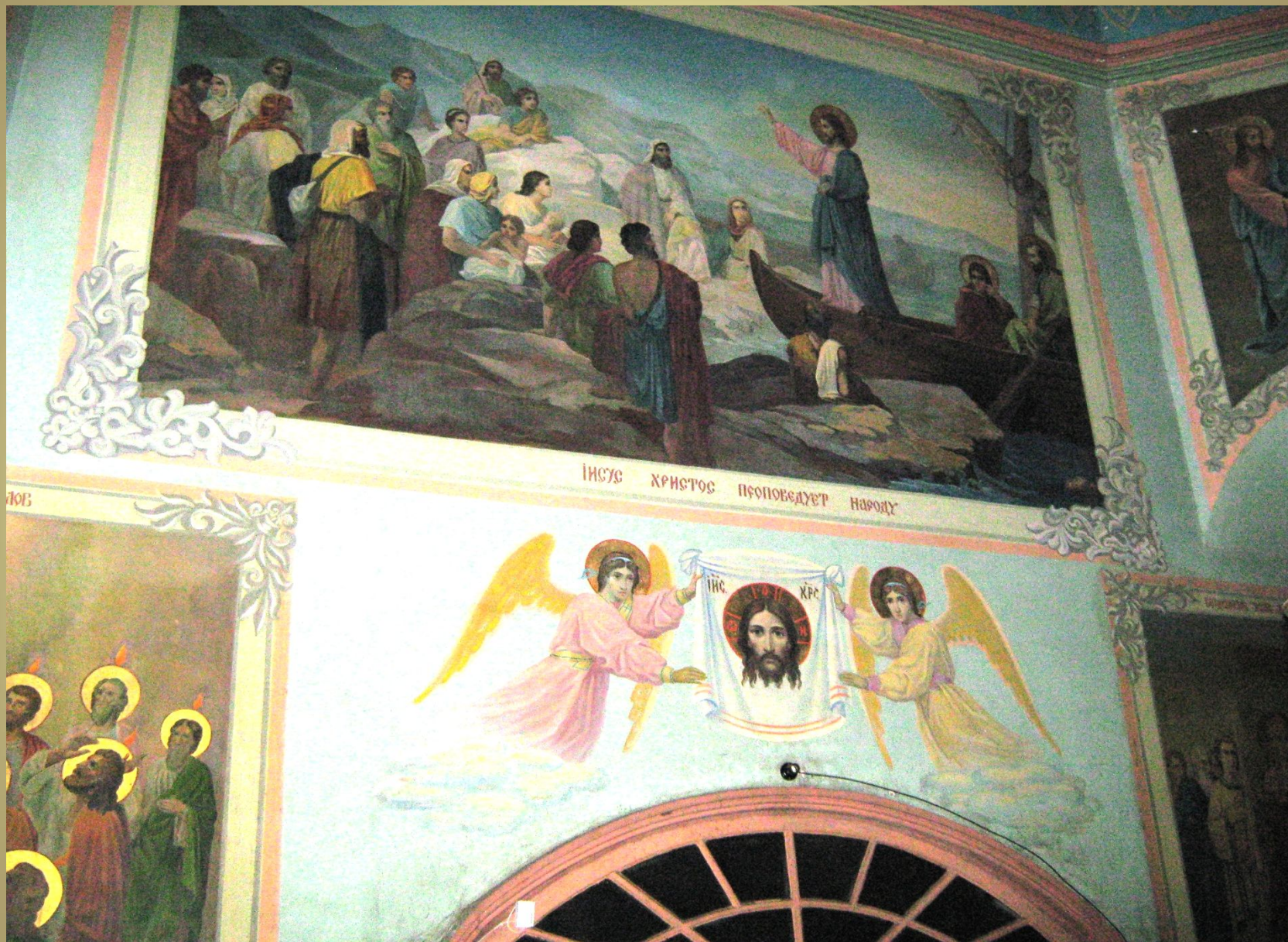
В конце XIX-начале XX века создана настенная живопись