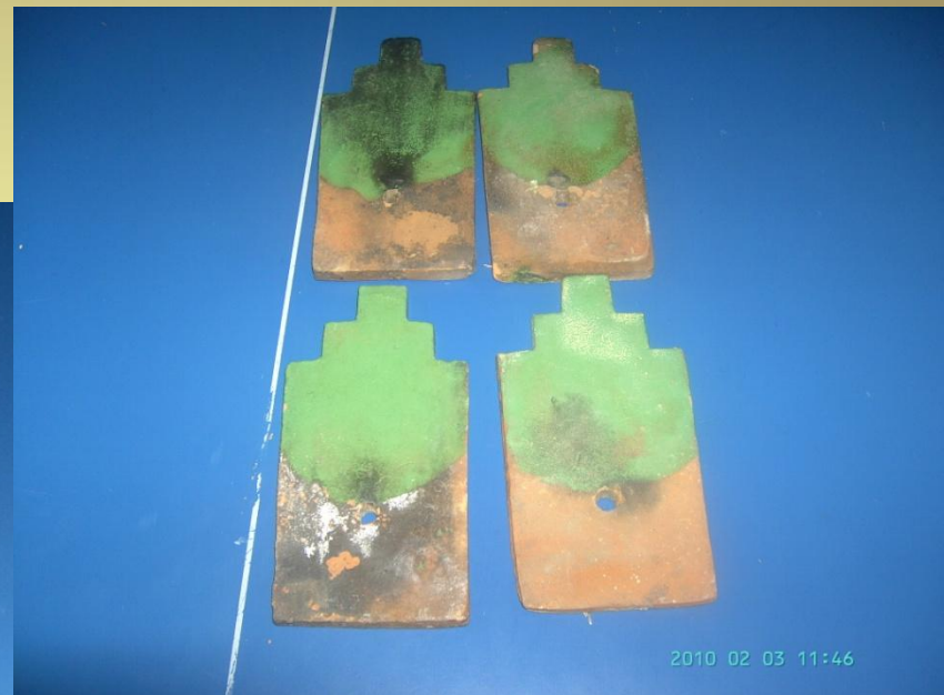
Глазурованная черепица с «луковицы» купола колокольни, разбитого ударом молнии 28 июня 2003 года