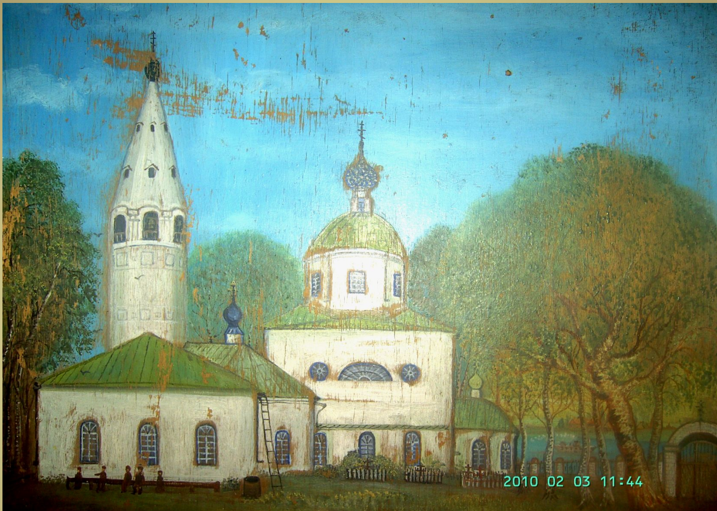
Копия с картины неизвестного художника Николаевская церковь в 50-е годы 20 века. «Зданием каменная с деревянным вверху осьмиугольником, отштукатуренная внутри и снаружи. Приходских селений 34 с числом прихожан 2910»( Из документа 1894 г.)