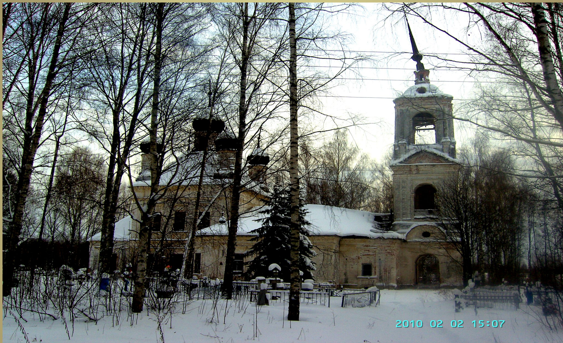
Кладбище при церкви действующее