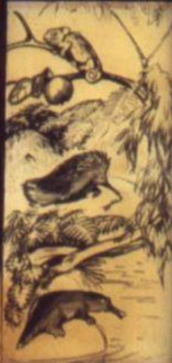
Иллюстрация И. Акимовича 1962

Много, очень много на земле диковинных существ. О некоторых из них, о том, какие они удивительные, вы можете прочитать в книжке И. Акимовича «Кто без крыльев летает».