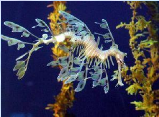
Лиственный морской дракон

Какое животное изображено на официальной эмблеме штата Южная Австралия. Отростки его, похожие на листья, служат ему для маскировки.