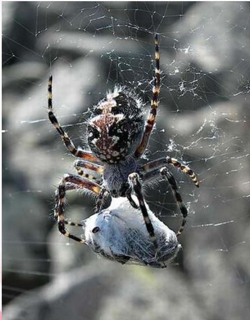
Паук - крестовик