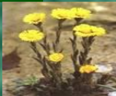
Мать –и – мачеха