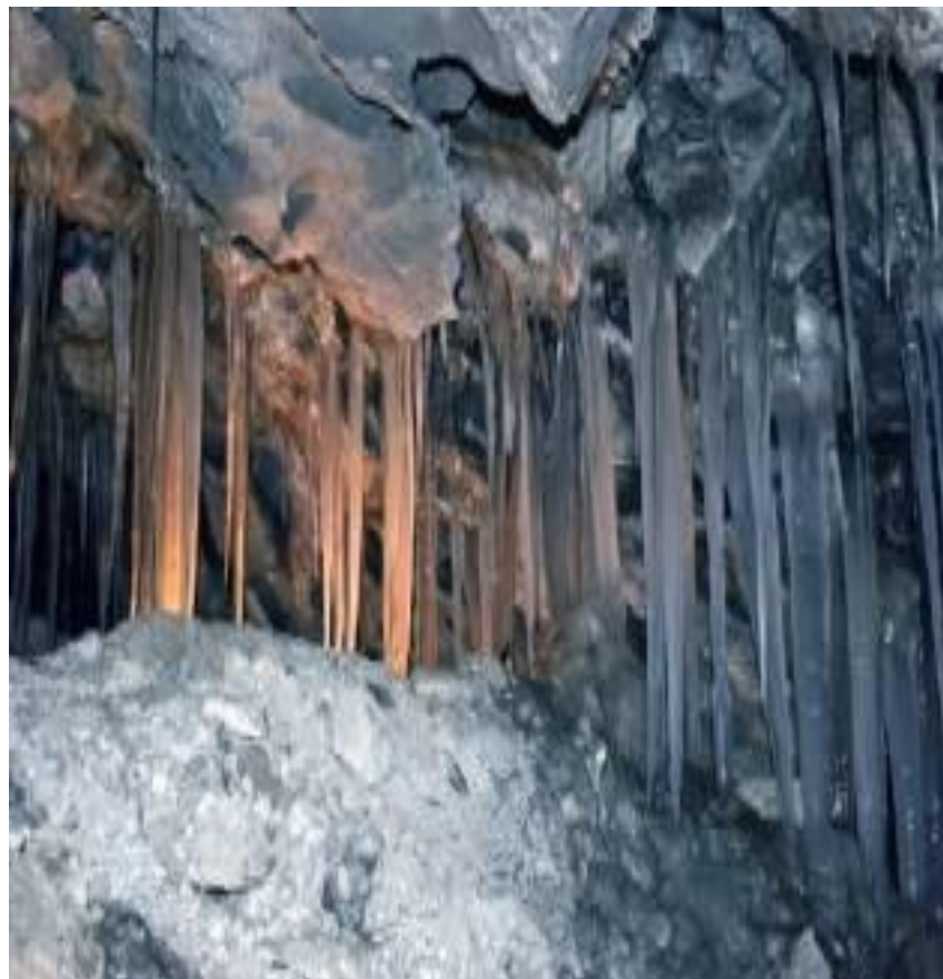
Кунгурская ледяная пещера