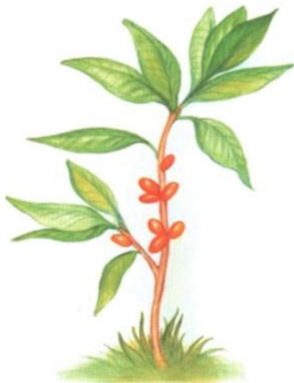
ВОЛЧЬЕ ЛЫКО (ядовитая)

Какое ядовитое растение леса связано с названием животного?