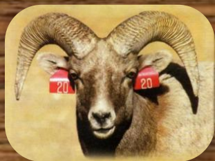
Снежный баран(чубук, толсторог)