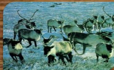
Дикий северный олень.