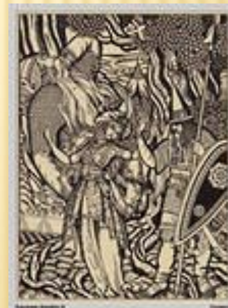
«Илья Муромец и жена Святогора»