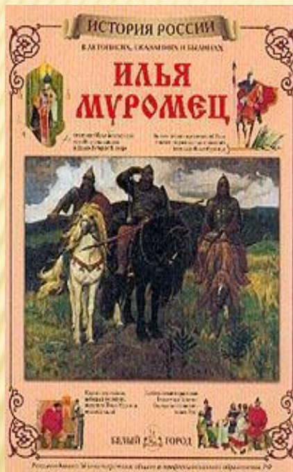
«Илья Муромец», История России