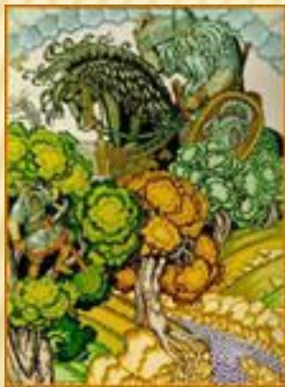
«Илья Муромец и Святогор»

К былинам об Илье Муромце Иван Билибин создал иллюстрации: «Илья Муромец», «Илья Муромец и Святогор», «Илья Муромец и Соловей-разбойник», «Илья Муромец и жена Святогора».