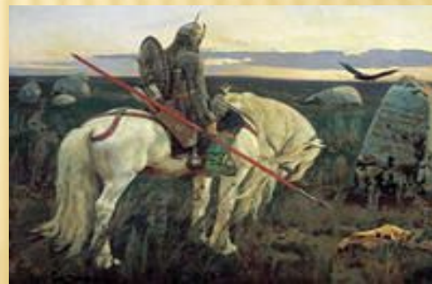
«Витязь на распутье»