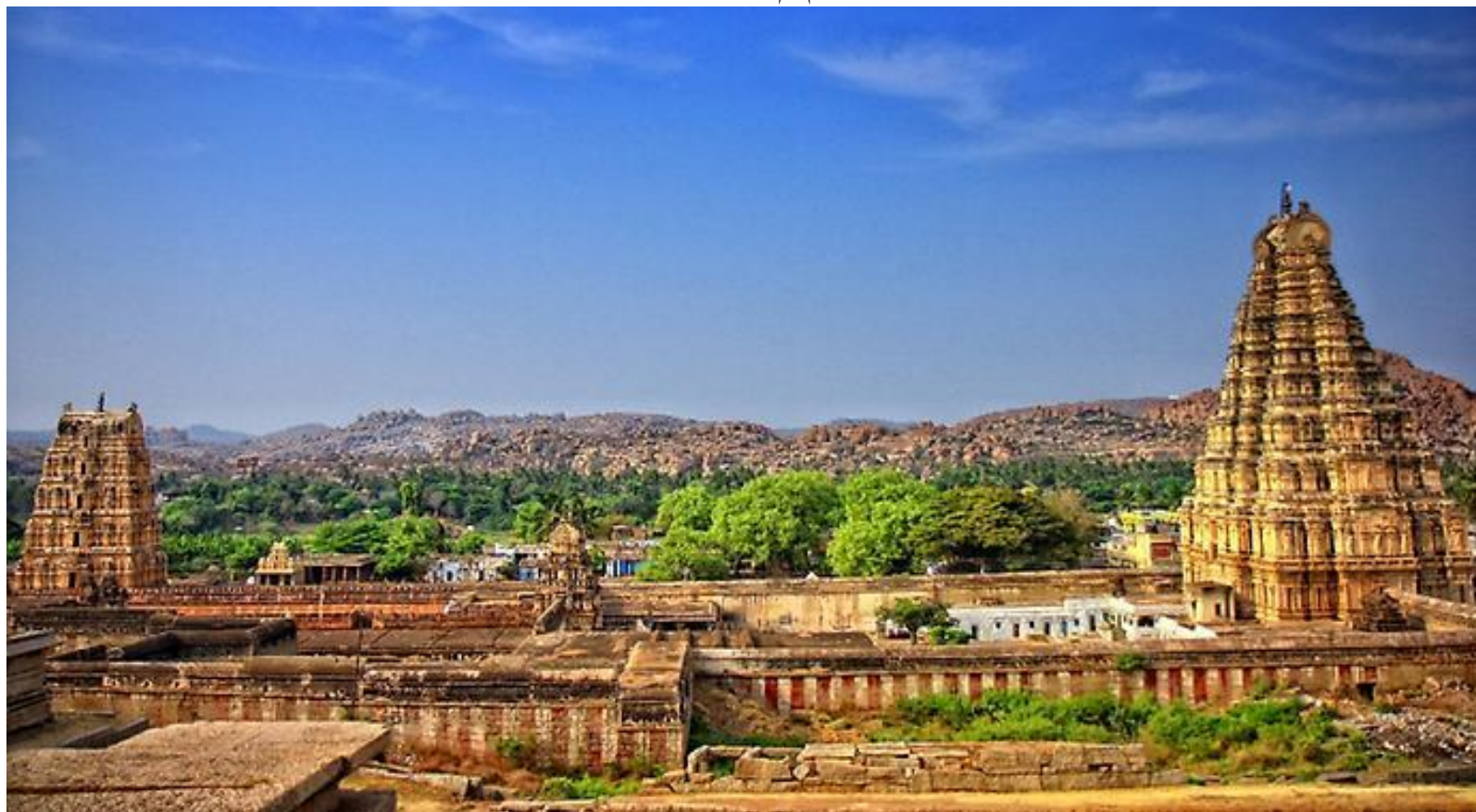
Храм Вирупакши в городе Хампи

СРЕДИ ДОСТОПРИМЕЧАТЕЛЬНОСТЕЙ ИНДИИ ОГРОМНОЕ КОЛИЧЕСТВО ПАМЯТНИКОВ АРХИТЕКТУРЫ И ЧУДЕС ПРИРОДЫ.