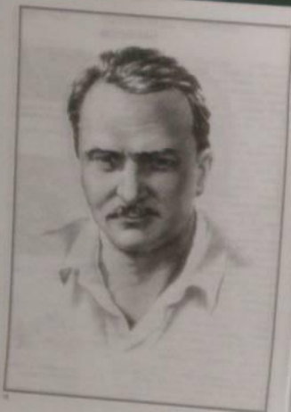
Виталий Валентинович Бианки