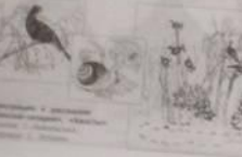
Бианки В. В. «Паучок-пилот»