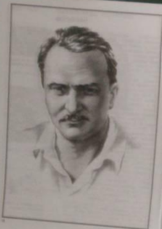
Виталий Валентинович Бианки 1894-1958

Виталий Валентинович Бианки (1894-1958) — русский писатель, натуралист, автор популярных книг о природе.