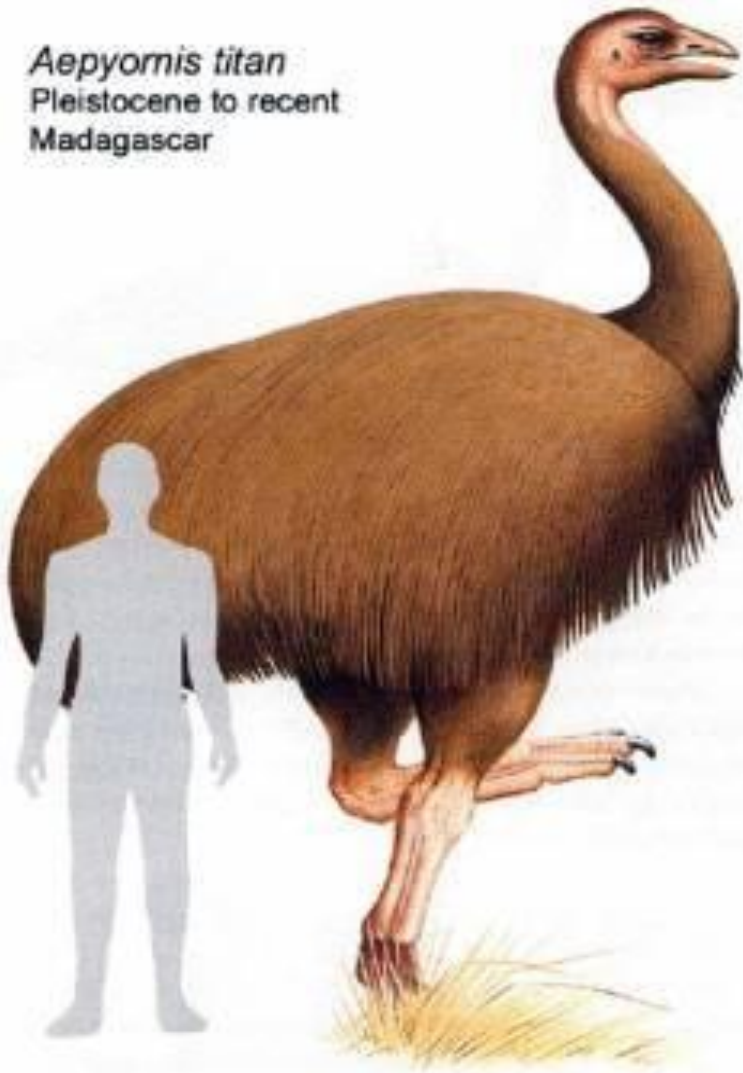
Aepyornis titan Pleistocene to recent Madagascar

. Наибольшая по размерам птица в мире – страус, который имеет рост от 2 м. Они очень быстро бегают и развивают скорость до 60 км/ч.