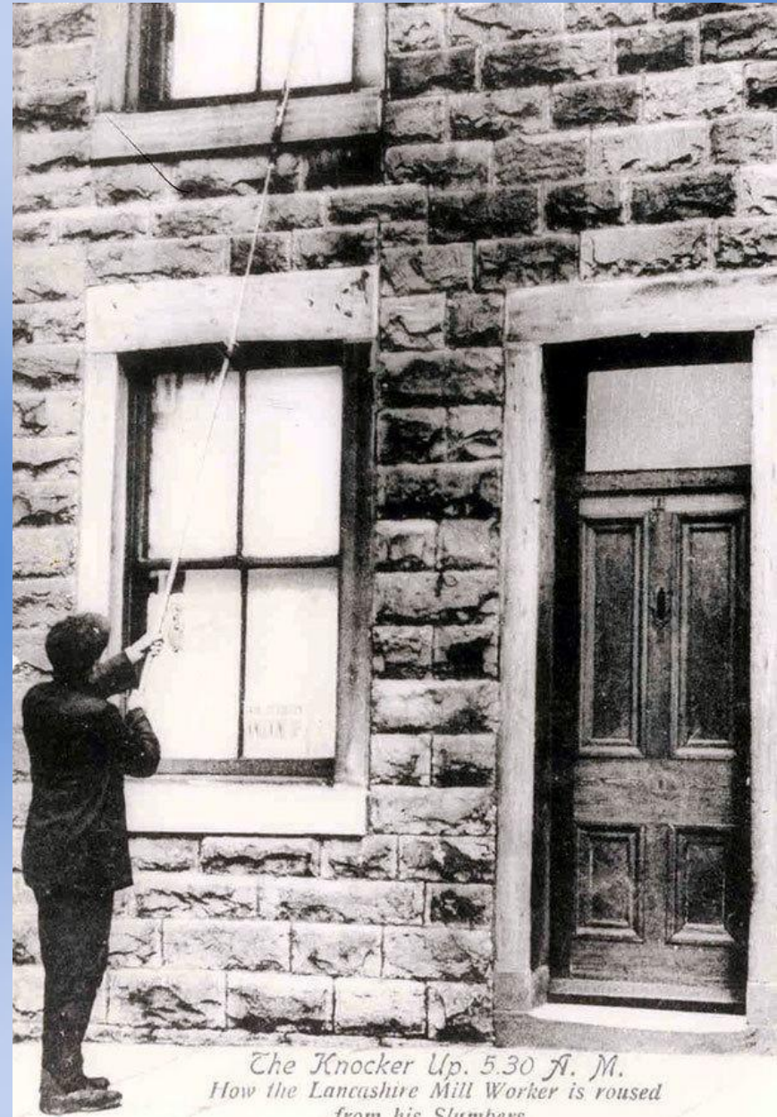
The Knocker Up, 5.30 A. M. How the Lancashire Mill Worker is roused from his Slumbers