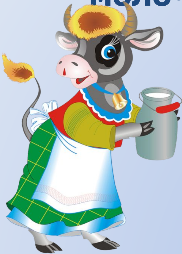
В чем польза молока?