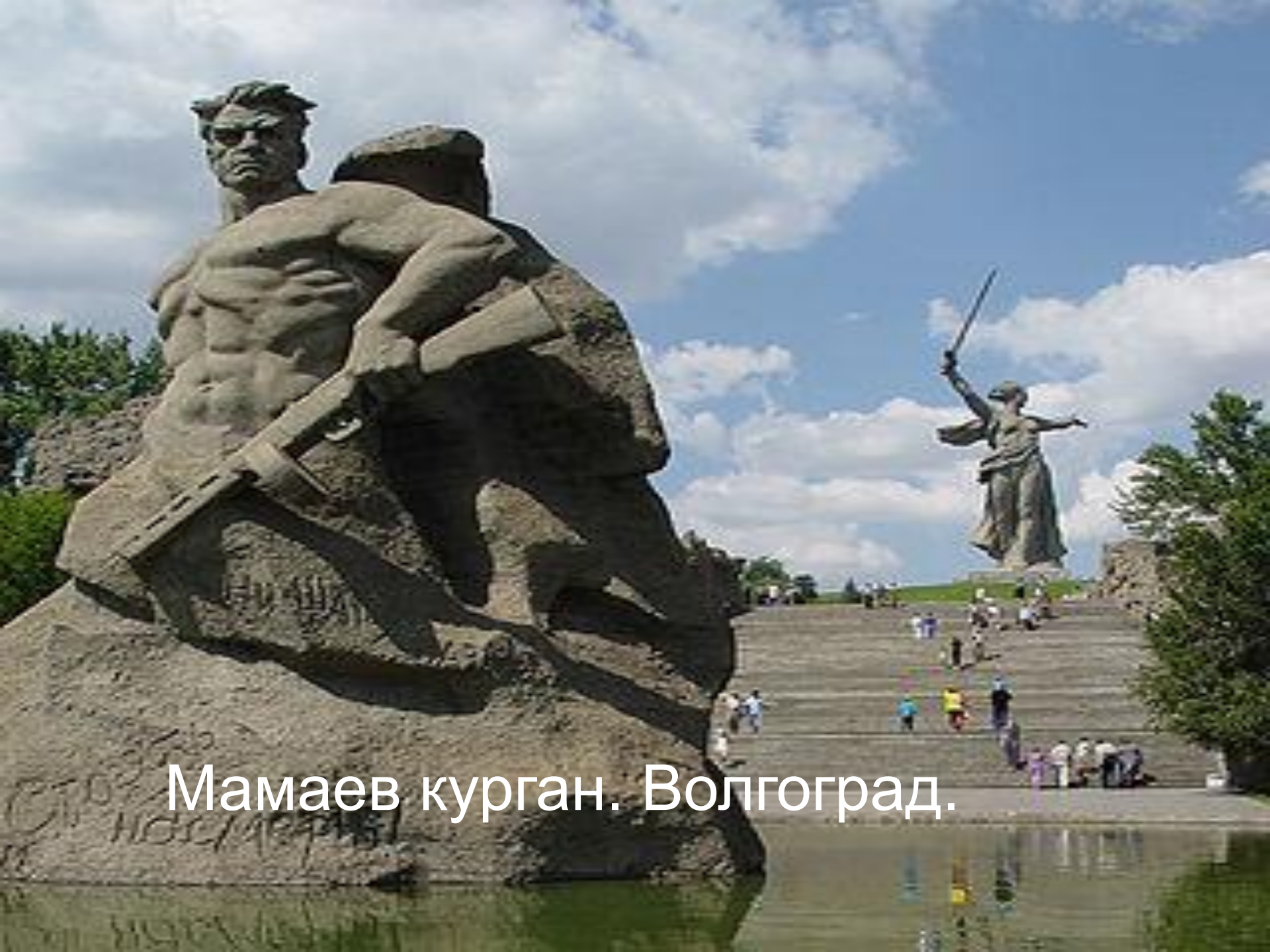
Мамаев курган. Волгоград.