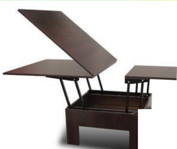
Стол - трансформер