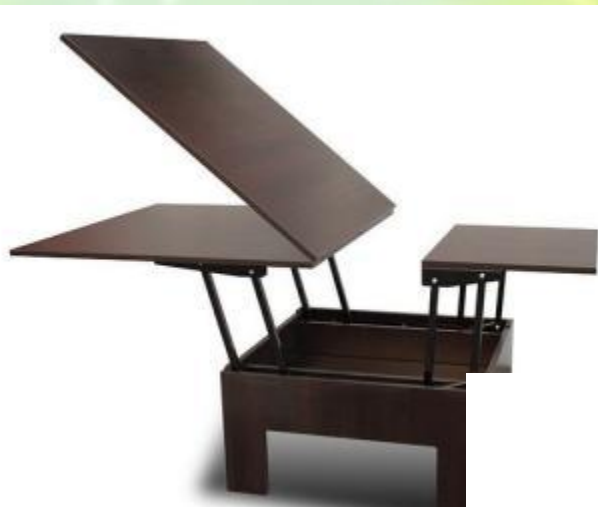
Стол - трансформер