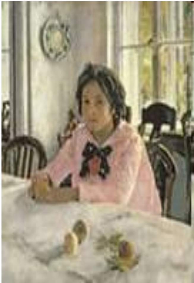
Девочка с персиками

Картина русского живописца Валентина Серова, написана в 1887 году, хранится в Государственной Третьяковской галерее. Картина написана в усадьбе Саввы Ивановича Мамонтова Абрамцево.