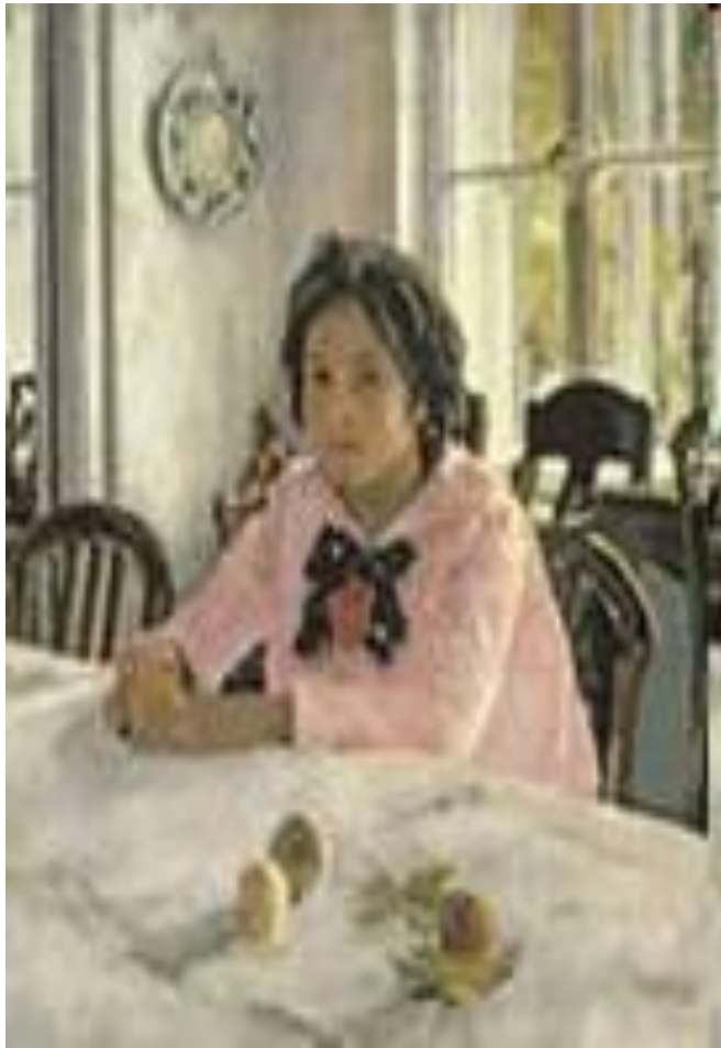
Девочка с персиками

Картина русского живописца Валентина Серова, написана в 1887 году, хранится в Государственной Третьяковской галерее. Картина написана в усадьбе Саввы Ивановича Мамонтова Абрамцево.