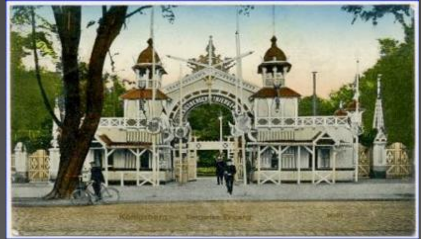
Königsberg, Tiergarten, Eingangsbereich, gel. 1912

Значительным событием стало возведение в 1912 г. в зоопарке вдоль ручья первого в Германии Прусского этнографического музея (в него были перевезены оригинальные здания деревенской кирхи, ветряной мельницы, кузницы, пекарни, дома восточнопрусских крестьян, др.). Это произошло благодаря деятельности университетского профессора доктора Беценбергера (Bezenberger).