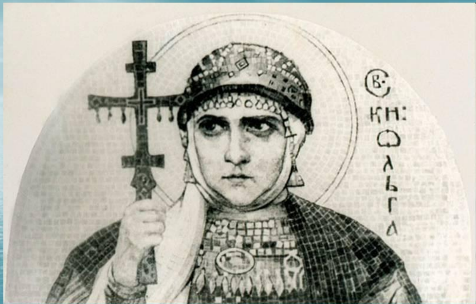
«Святая Ольга». Эскиз к мозаике Н. К. Рериха. 1915