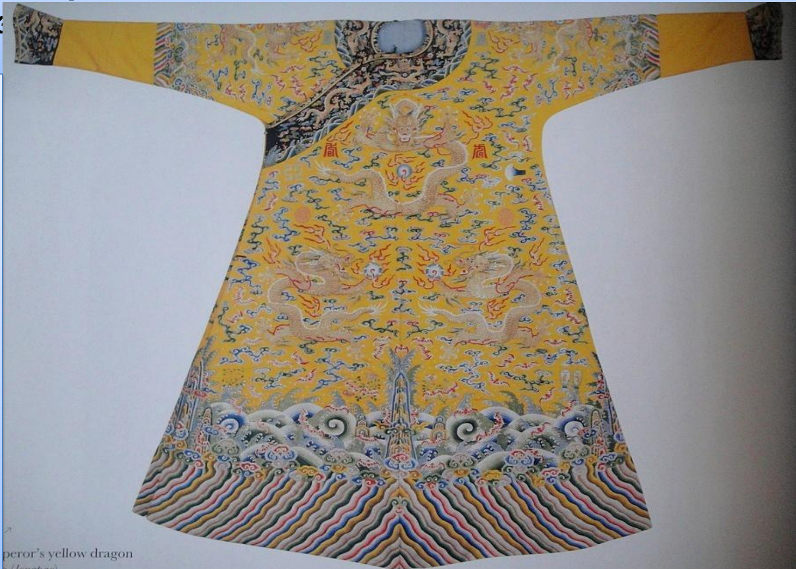
peror's yellow dragon (longpao)

Одежда китайцев была удобной, шилась из шелка и хлопка, украшалась вышивкой шелком и золотыми нитями. В декоре использовалась определенная система изображений. Вышитый шелковый халат стал своеобразным