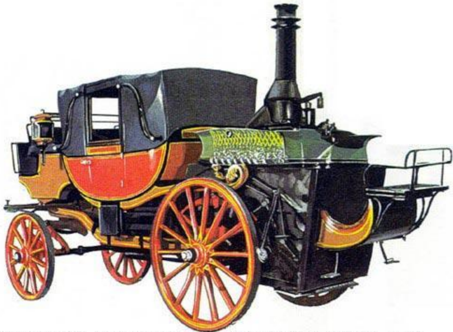
Паровой автомобиль Бордино 1854 год.