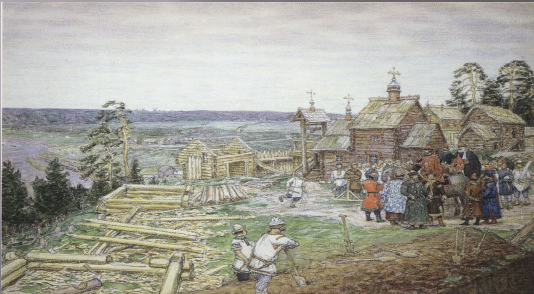
А. ВАСНЕЦОВ Основание Москвы

Слово «город» в древности означало только деревянные или каменные стены.