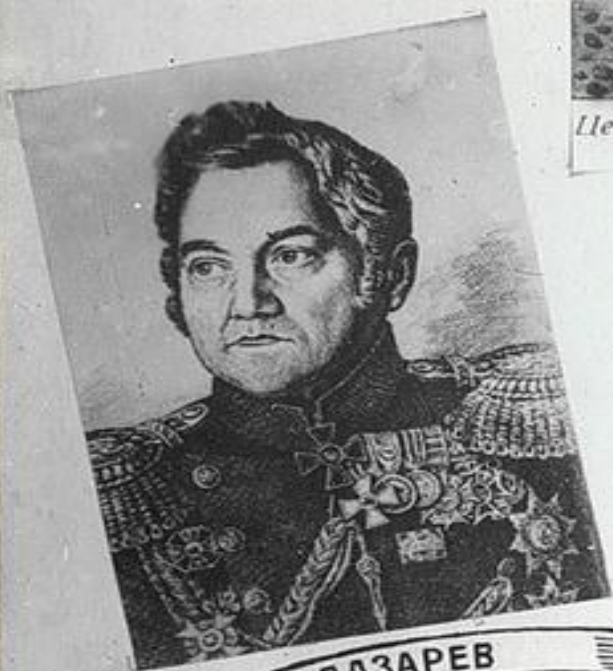
М. П. ЛАЗАРЕВ