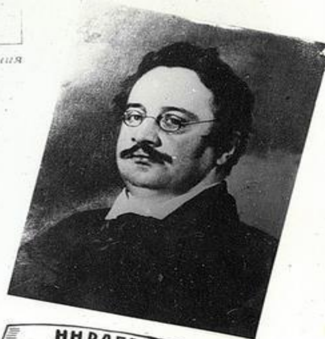
Н. И. РАЕВСКИЙ