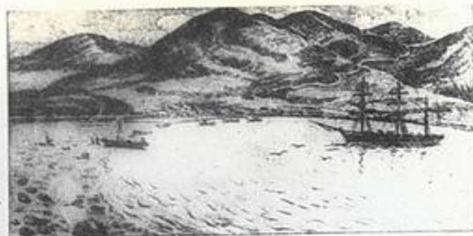
Цемесская бухта в 1833 г. до основания г. Новороссийска.

В 1839 году строительство укрепления в Цемесской бухте получает имя Новороссийск.