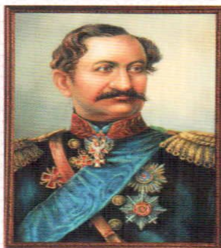
Лазарь Маркович Серебряков