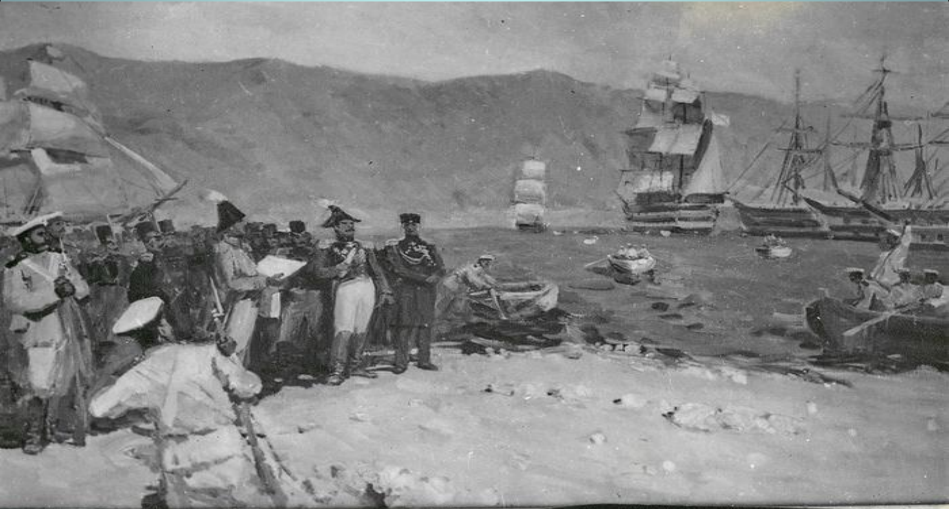
Высадка десанта в Цемесской бухте 12 сентября 1838 г.

В 1791 году наши русские солдаты отвоевывают у турков главную базу флота Турции Суджук-Кале, и Цемесская бухта переходит к России. И в далеком 1838 году началось строительство форта.