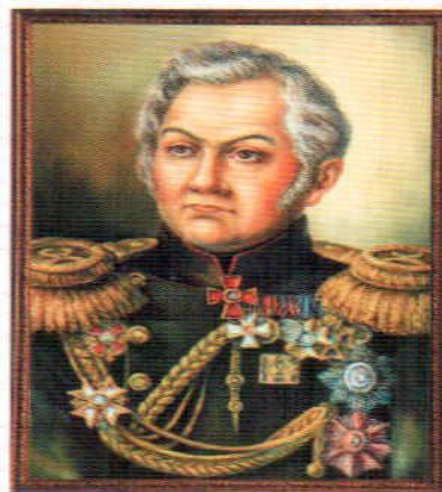
Михаил Петрович Лазарев