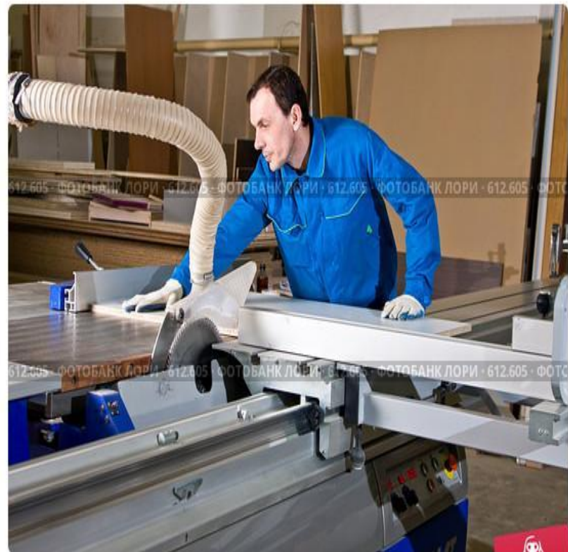
Рабочий за станком на мебельной фабрике