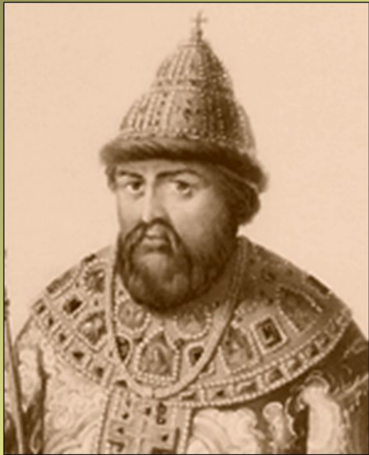
Алексей Михайлович ( отец Петра I )