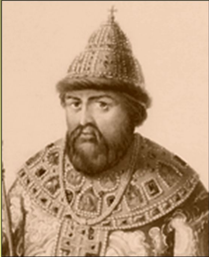
Алексей Михайлович ( отец Петра I )