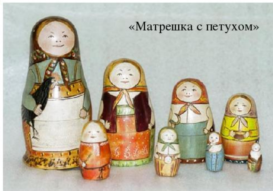
«Матрешка с петухом»