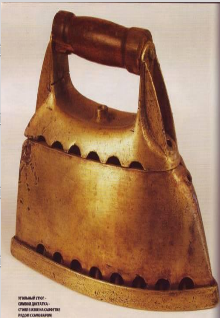
УГОЛЬНЫЙ УТЮГ - СИМВОЛ ДОСТАТКА - СТОЛ И КИЗЕ НА САЛФЕТКЕ РЯДОМ С САЛОВАРОМ

-Утюг- тяжелый нагревающийся металлический прибор для глажения одежды и тканей