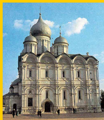
Успенский, Благовещенский и Архангельский соборы Московского кремля

Главным собором Кремля стал, возведенный Аристотелем Фиорованти Успенский собор.