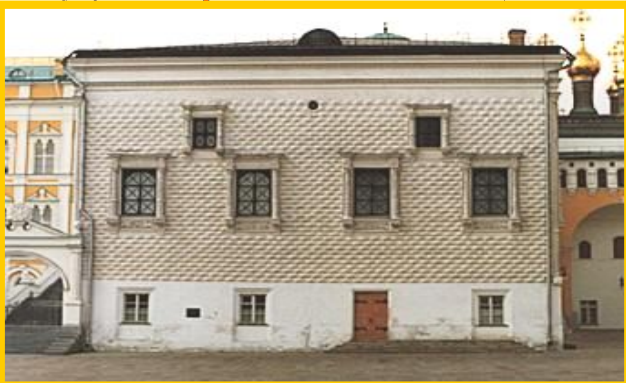
Грановитая палата Московского кремля.

Наряду с соборами, в Кремле были возведены и светские здания. Знаменитая Грановитая палата, облицованная граненым камнем, стала резиденцией царя. В ней устраивали приемы послов, заседали Земские соборы, устраивались праздничные обеды.