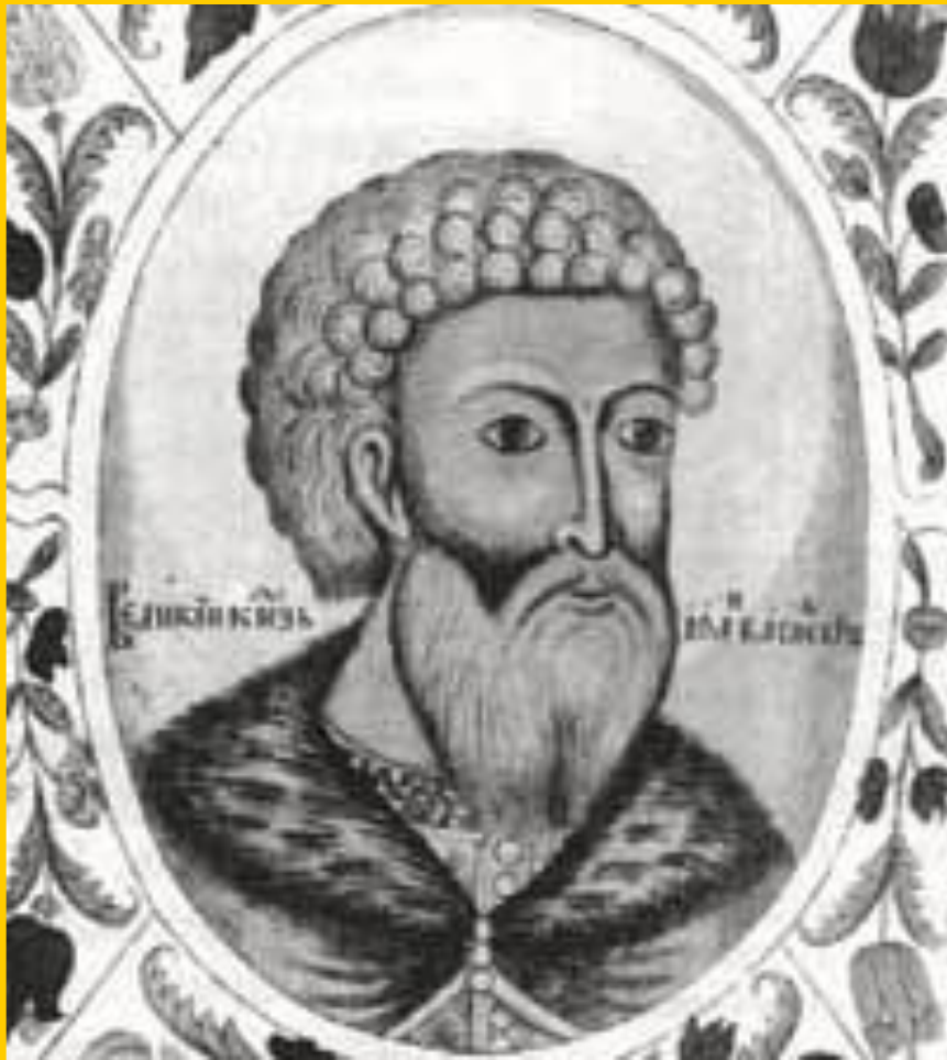
Иван III. Гравюра XVI века.

Вскоре Иван III начал называть себя «государь всея Руси» и присвоил себе царский титул, который в Европе не признали.