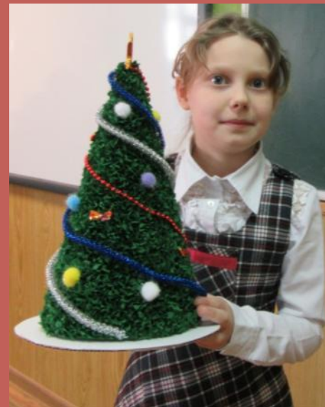
Ёлка из гофрированной бумаги.