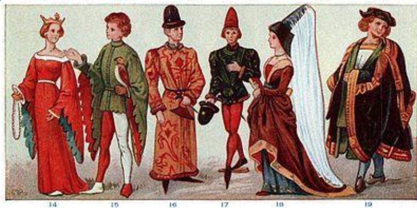
DRESS OF ANCIENT PERIOD (SEE DESCRIPTION FOLLOWING)