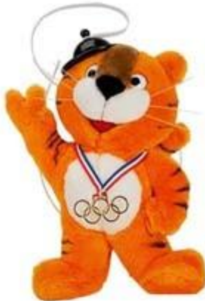
Игры XXIV Олимпиады 1988 , Сеул (КОРЕЯ): тигренок Ходори . Фольклорный персонаж, герой корейских легенд.