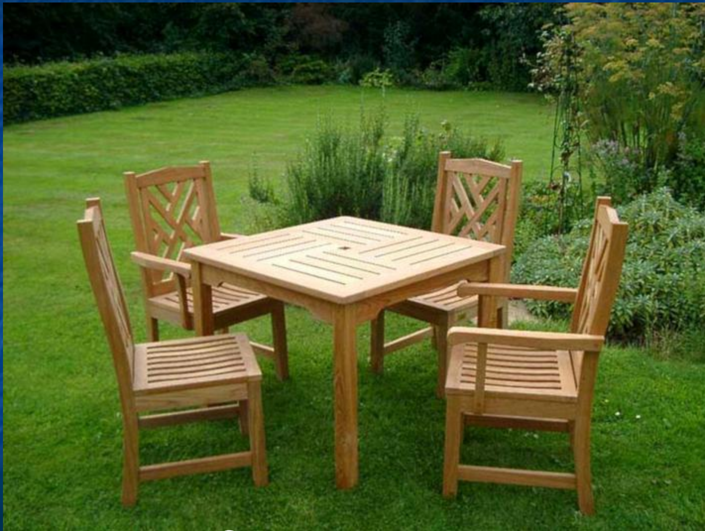
Стол со стульями