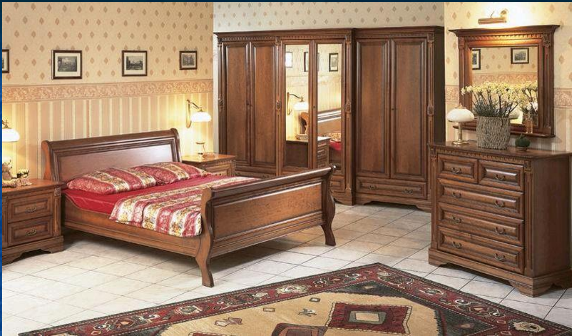
Спальный гарнитур из дерева