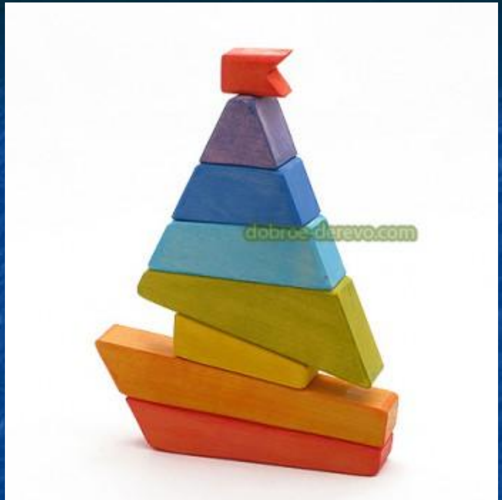
Пирамидки из дерева