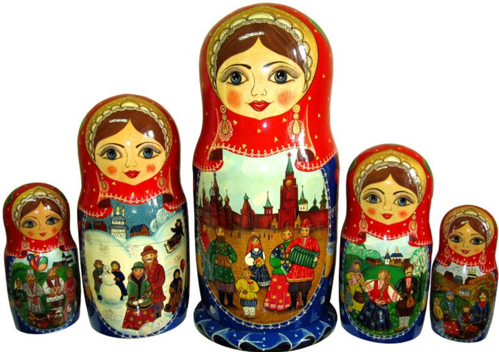
Матрешки из дерева