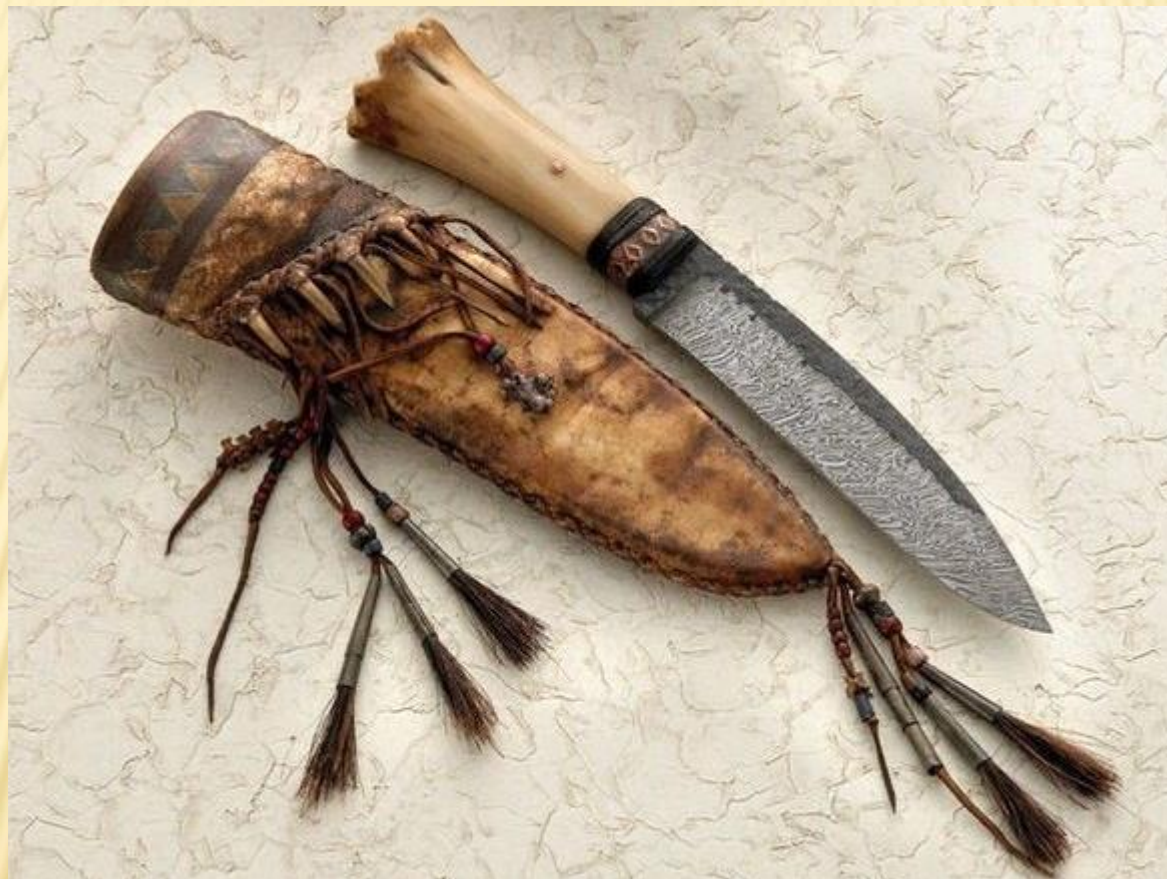
ЧЕХОЛ ДЛЯ НОЖА