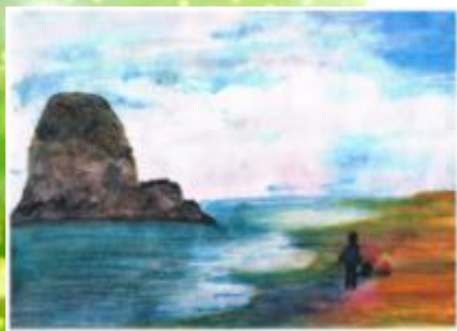
Рисование по мокрой бумаге