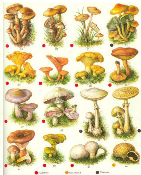
К. с. Г. р. б. 1. Белый, 2. Пластинчатый, 3. Желтый, 4. Сатанинский, 5. Мухомор ядовитый, 6. Паутинник, 7. Масленок