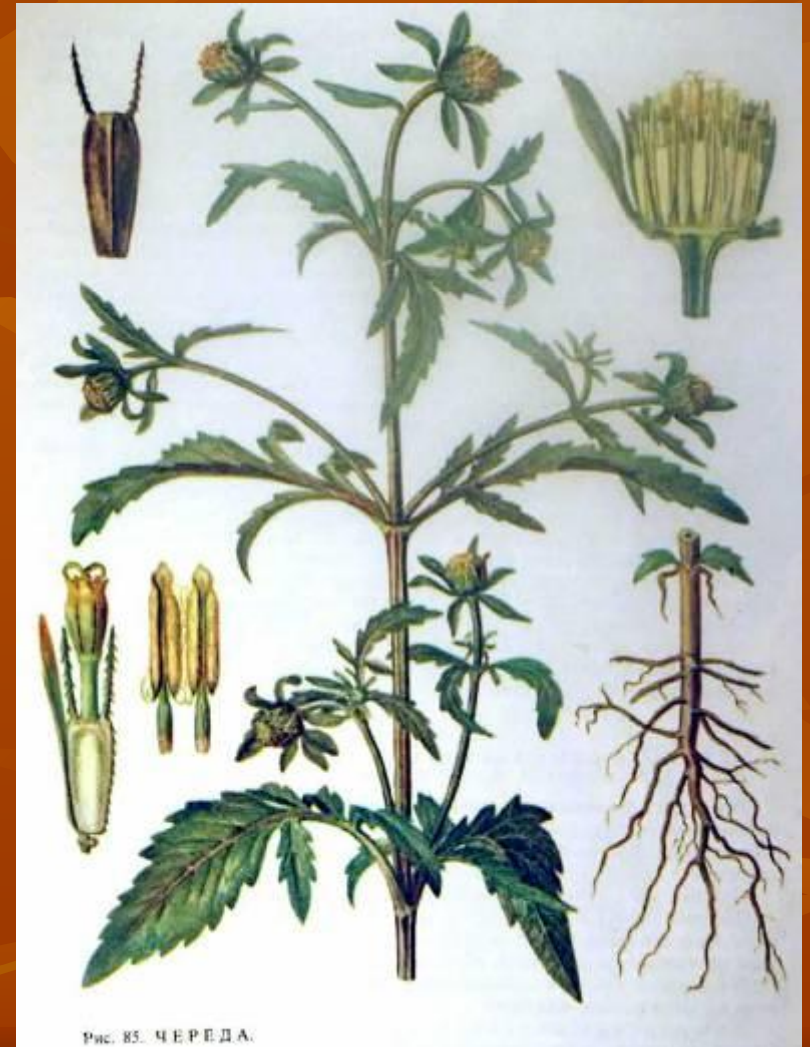
Рис. 85. ЧЕРЕДА.