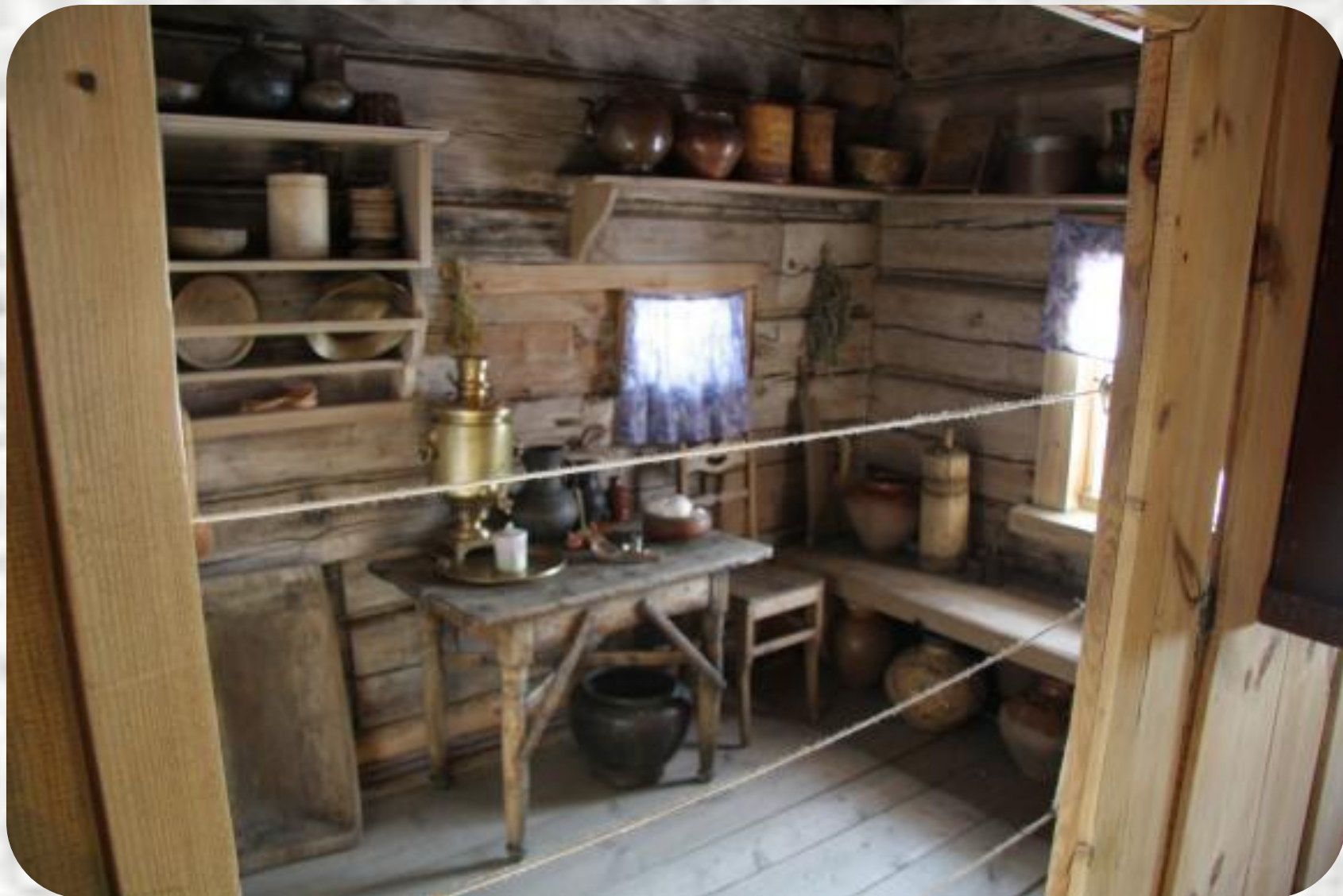
Жилая часть крестьянского дома.