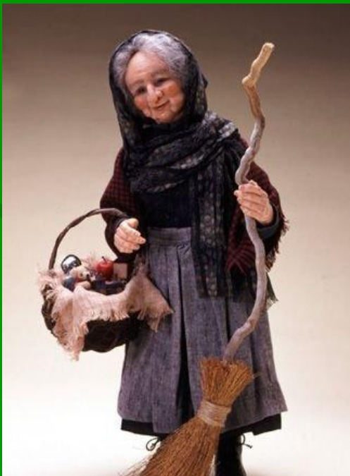
Новогодний персонаж- Бефана

Все итальянские ребята с нетерпением ждут добрую Фею Бефану. Она прилетает ночью на волшебной метле, открывает двери маленьким золотым ключиком и наполняет подарками детские чулки, специально подвешенные к камину. А тому, кто плохо учился или шалил, Бефана оставляет щепотку золы или уголек.