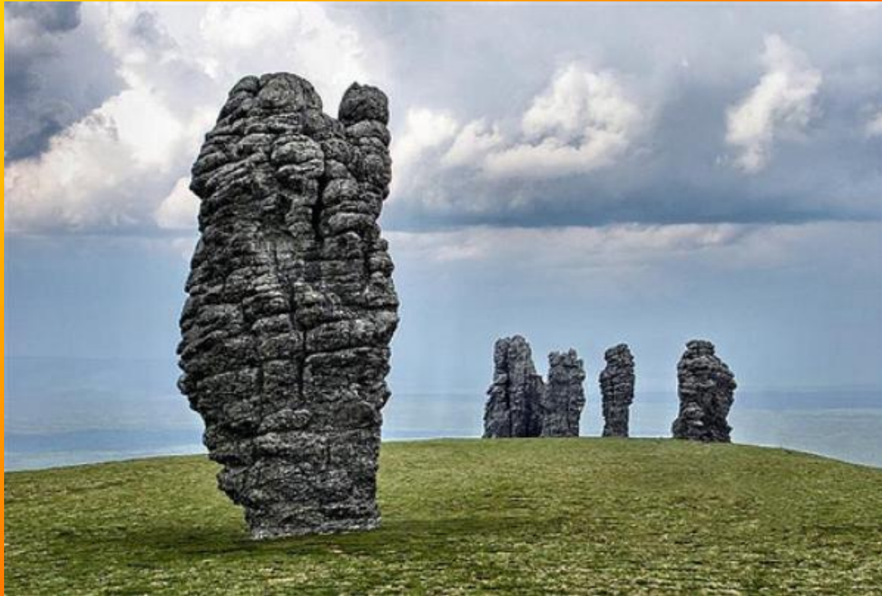
Столбы выветривания на горе Мань-Пупу-Нер на Северном Урале