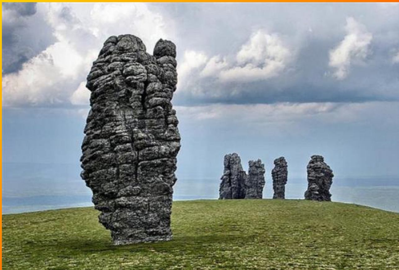
Столбы выветривания на горе Мань-Пупу-Нер на Северном Урале