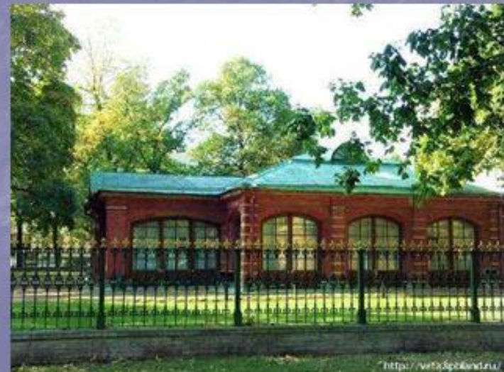
Домик Петра /