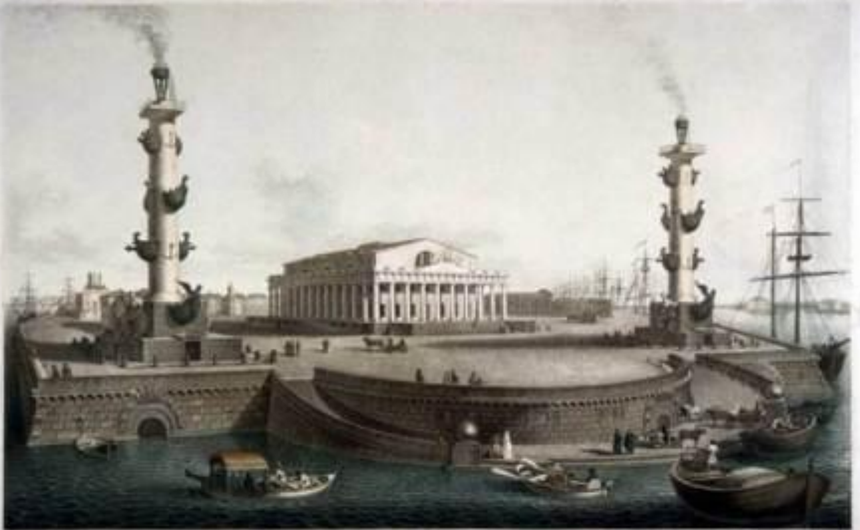
Видъ на верфи на Императорскаго Флота въ Императорской Адмиралтействъ Канцеляршкѣ въ Кронштадтѣ