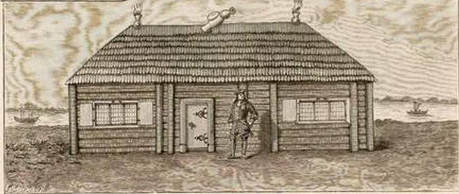
ДОМИКЪ ПЕТРА ВЕЛИКАГО